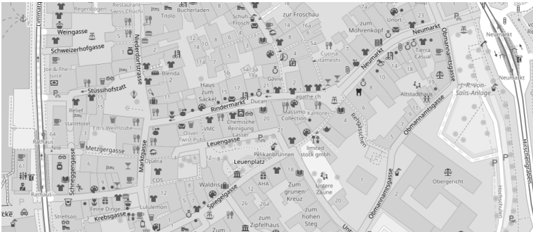
Christengemeinschaft: Untere Zäune 19 – Tram 3 bis Neumarkt

Eine gemeinsame Tagung von Anthroposophische Gesellschaft Schweiz, Michael-Zweig Zürich Die Christengemeinschaft, Gemeinde Zürich